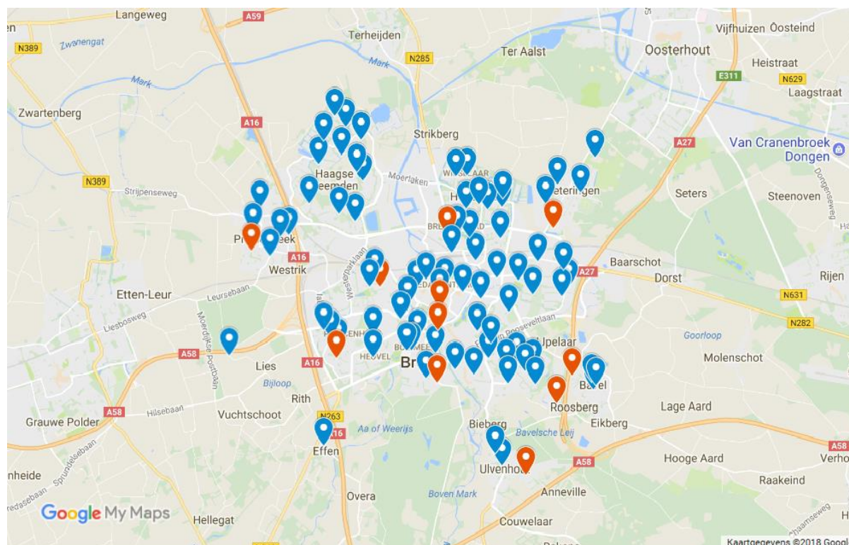
Figuur 4: Stembureaus in de gemeente Breda voor de gemeenteraadsverkiezingen van 2018

Noot: bestaande stembureaus zijn aangegeven in blauw. Nieuwe stembureaus in rood.