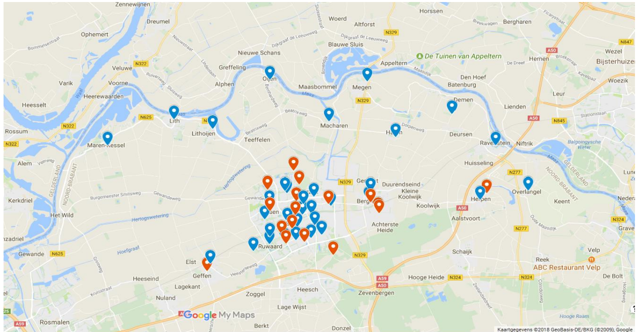
Figuur 3: Stembureaus in de gemeente Oss voor de gemeenteraadsverkiezingen van 2018

Noot: bestaande stembureaus zijn aangegeven in blauw. Nieuwe stembureaus in rood.