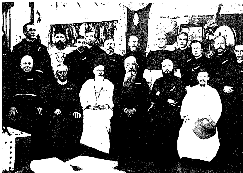
Bestuursleden van de Verenigde Missionarissen bij gelegenheid van de Haagse Missieweek in 1920.

aanspreekpunt bij hun streven naar een zo aantrekkelijk mogelijke presentatie van het tentoonstellingsmateriaal dat hun werd aangeboden. Op hun beurt wilden de missionerende instituten via de tentoonstellingen optimaal bekendheid geven aan de eigen missiewerken. In de tweede fase (1928-1952) gaat de Verenigde Missionarissen op het punt van de tentoonstellingen eisen stellen en werpt het contactorgaan zich nadrukkelijk op als spreekbuis en belangenbehartiger van de particuliere missieactie. In de derde en laatste fase (1952-1969) moet de Verenigde Missionarissen de provinciaalsvergadering van de Stichting Nederlandse Priester Religieuzen naast en boven zich dulden. Geleidelijk aan wordt de eigen rol van de Verenigde Missionarissen verkleind.