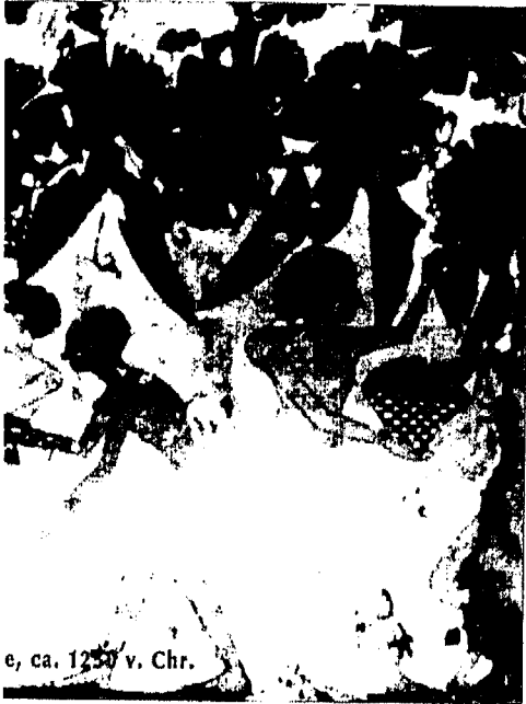
e, ca. 1250 v. Chr.

De farao is een mens die over mensen heerst. Ondanks deze ongelijkheid beschouwt Hegel de overgang naar het Egyptische Rijk als een vooruitgang. De goddelijke macht wordt nu niet langer door een dierenfiguur, maar in een (dood) mens tot voorstelling gebracht. Daarin schemert al beter door wat de werkelijke aard is van de goddelijke macht: de goddelijke macht moet als geest begrepen worden.