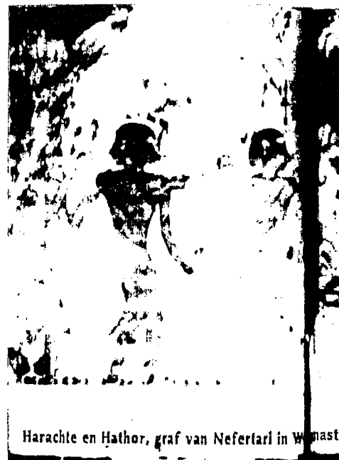
Harachte en Hathor, graf van Nefertari in W. masti

In de strijd op leven en dood tussen de stammen, wordt de stammenmaatschappij alsnog met de dood geconfronteerd. In de stammen-oorlog sneuvelen niet alleen individuele stamleden, maar kan ook de stam als geheel uitgeroeid worden. Het onsterfelijk gewaande to-